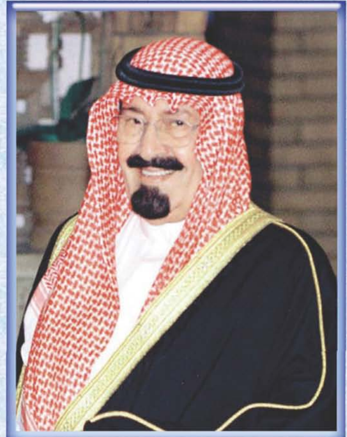
Custodian of the Two Holy Mosques King Abdullah Ibn Abdul Aziz Al-Saud